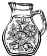
САНГРИЯ | SANGRIA 2 100