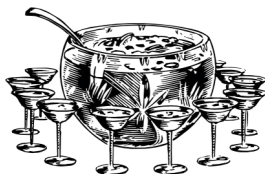
ПЛАНТЕРС ПУНШ | PLANTER'S PUNCH 2 900